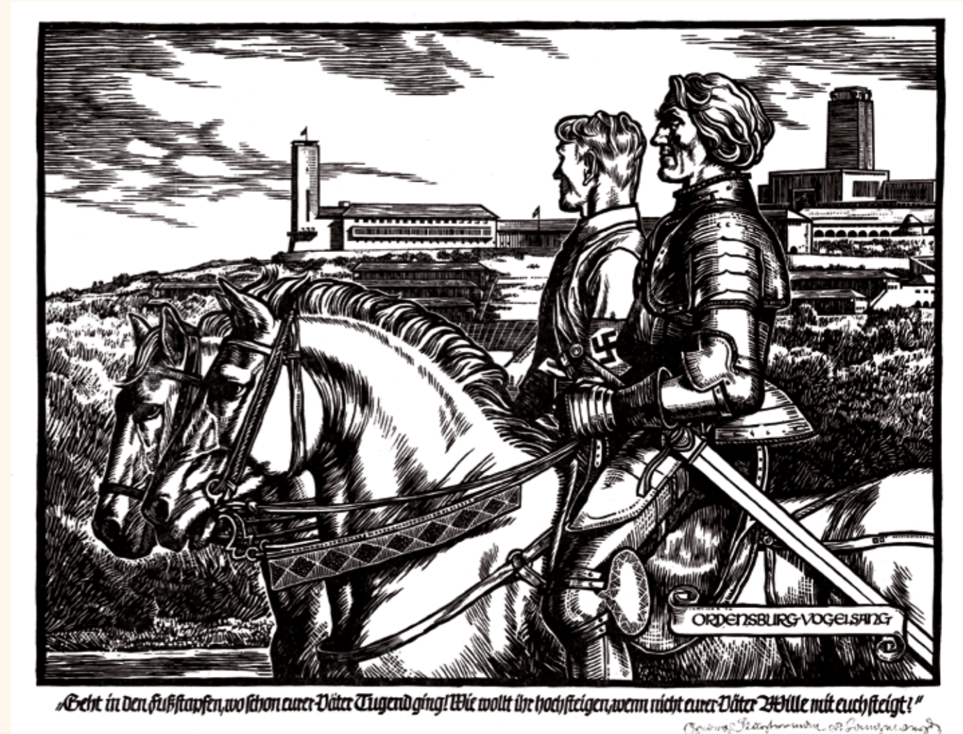
Abb. 7: Georg Slyterman von Langweyde, Holzschnitt „Ordensritter und Ordensjunker zu Pferd“. Erinnerungsdruck an das Burgfest Vogelsang im August 1939, Archiv Vogelsang IP.

Bereits Anfang 1936 begannen auch im Saarland unter strengster Geheimhaltung die Aktivitäten „zur Befestigung der Westgrenze“, die als Teil eines Konzeptes zur Landesverteidigung zu verstehen sind. Dieses sah vor, die deutschen Grenzgebiete zwischen Mosel und Rhein bis zum Jahr 1942 durch Sperrstellungen als „befestigte Zonen“ einzurichten. Dies geschah noch vor dem Einmarsch der deutschen Wehrmacht in das entmilitarisierte Rheinland am 7. März 1936, was wie dieser Einmarsch gegen wesentliche Auflagen des Versailler Vertrages und auch gegen den mit den westlichen Alliierten geschlossenen Garantiepakt des Vertrages von Locarno (1925/1926) verstieß. Am 12. März 1936 wurde dann auf Befehl des Oberkommandos des Heeres mit dem Bau von Sperrbefestigungen an den Saarübergängen im Saarland und mit der Errichtung von Befestigungen am Oberrhein begonnen (Threuter 2009). Von diesem Befehl waren auch der Montclair-Berg und sein östliches Vorland um St. Gangolf betroffen (Fontaine 2004, 92–95).